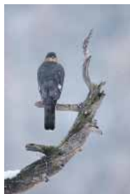
Allocco degli Urali